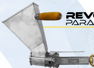
REVOCADORAS PARA TECHO